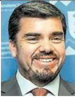
SEÑOR SEREMI DE TRANSPORTE Y TELECOMUNICACIONES