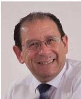
SEÑOR SEREMI DE EDUCACIÓN

Dirección: Manuel Bulnes N° 590, Piso 7, Temuco.