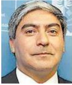
SEÑOR SEREMI DE OO.PP.