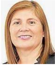
SEÑORA SEREMI DE LA MUJER