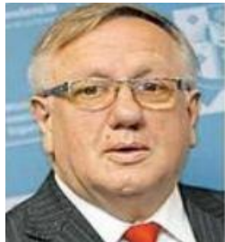
SEÑOR SEREMI DE ENERGÍA

Dirección: Varas 989 Oficina 605 – Temuco Edificio Capital