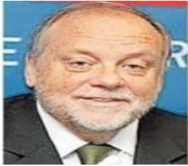
SEÑOR SEREMI DEL DEPORTE

Antonio Varas 989, Edificio Capital, Oficina 1504, Piso 15, Temuco.