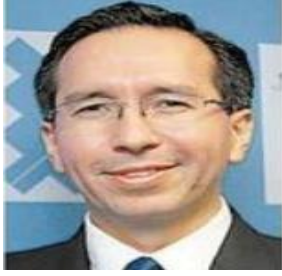
SEÑOR SEREMI DE DESARROLLO SOCIAL