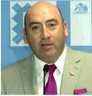
SEÑOR SEREMI DE AGRICULTURA