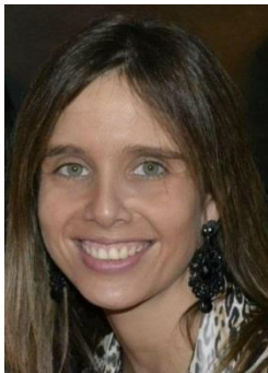
SEÑORA SEREMI DE JUSTICIA

Dirección: General Mackenna N° 574 3º piso Temuco.