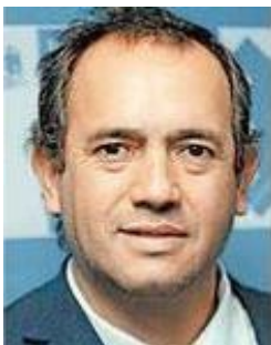
SEÑOR SEREMI DE VIVIENDA Y URBANISMO