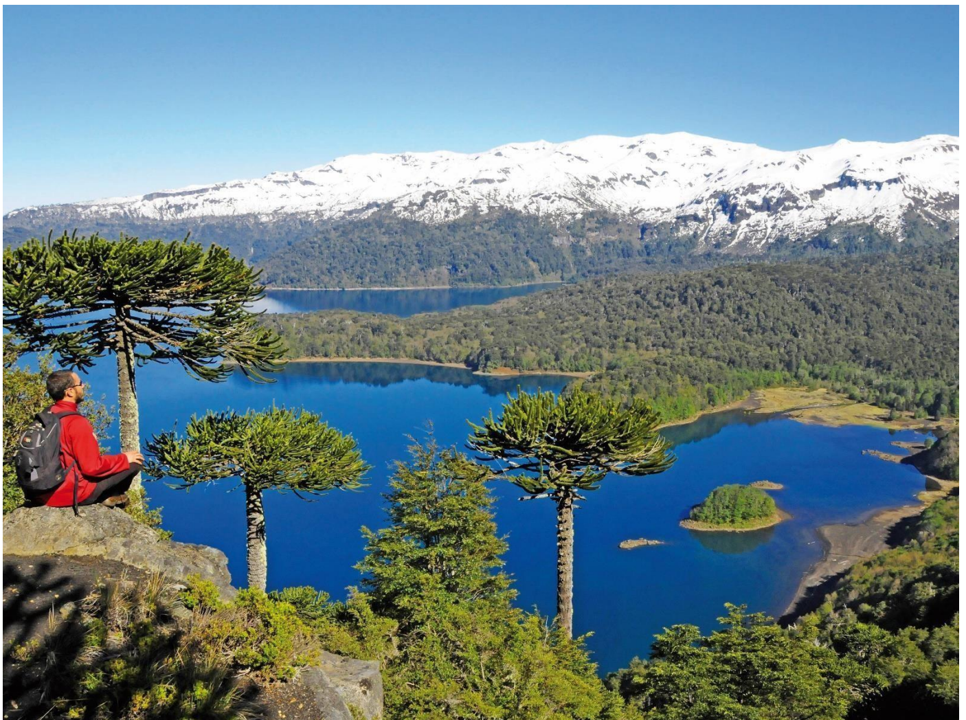
Imagen: Luis Lara Aguilar