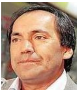
SEÑOR SEREMI DE TRABAJO Y PREVISIÓN SOCIAL

Dirección: Vicuña Mackenna N° 099 Esq. Bilbao, Temuco.