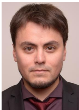
SEREMI DE LAS CULTURAS, LAS ARTES Y EL PATRIMONIO

Dirección: Claro Solar N° 835 piso 10 of, Torre Campanario